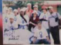
LA CARAVANE ARRIVE