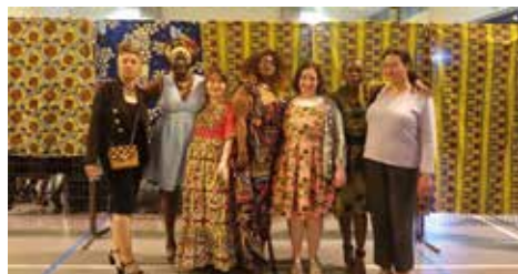
Association Princess Vingtanie