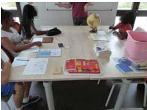
Soutien scolaire «ASEER»

Et sur Empalot ils seront nombreux à vivre longtemps vu le temps passé dans les différentes structures associations du quartier pour tendre la main: Aidons nous, Soli Sol, Générations Solidaires, ASEER, Karavan, Aifomej, HASUR-E,