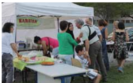
Bénévoles action «Karavan»

Soutenu par la Direction de la Vie Associative du Ministère de la Jeunesse et des Sports, le ministère de l'Éducation nationale et la Caisse des Dépôts et consignations, le Passeport Bénévole a été créé par France Bénévolat en 2008. Il permet à tout bénévole de faire fructifier son engagement bénévole dans son parcours professionnel, que ce soit pour se renforcer dans son profil et sur ses compétences ou pour évoluer du point de vue de celles-ci. Ce carnet peut être utilisé dans le cadre d'un entretien d'embauche ou de manière plus formelle, dans les dispositifs de validation des acquis de l'expérience (VAE). Le Passeport Bénévole est une passerelle entre le bénévolat associatif et la vie professionnelle. Suite page 12