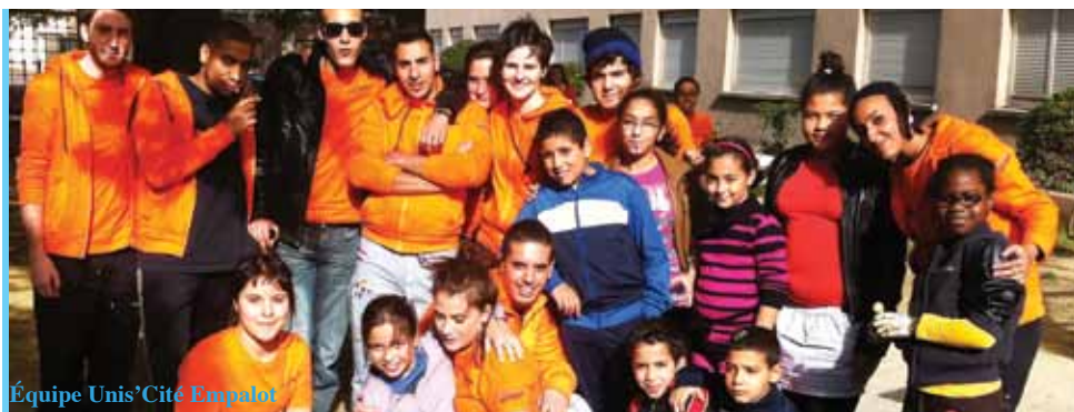
Équipe Unis'Cité Empalot

Témoignages sur le thème du mois : «Bénévoles: faiseurs de liens»