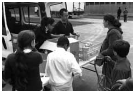
Distribution goûters «Aifomej»

Faute de rétributions financières ou de compensations, les explications sur le pourquoi de l'activité bénévole et les mobiles du bénévolat prendront facilement une dimension psychologique reconnue, parfois avouée, souvent attribuée, par les promoteurs et les acteurs eux-mêmes. Certains choisissent le bénévolat par convictions religieuses. D'autres, déçus par la superficialité des rapports sociaux, recherchent un contact plus authentique. D'autres encore aident leurs prochains parce qu'ils ont eux-mêmes trouvé soutien quand ils en ont eu besoin (ndr – interview Marion Bezombes p11). Leur point commun : une véritable démarche de développement personnel. La dimension de plaisir et d'épanouissement est toujours présente. Ce qui est normal, car pour être bien avec l'autre, il faut être bien avec soi-même. Cependant, il en va du bénévolat comme de tous nos actes. La