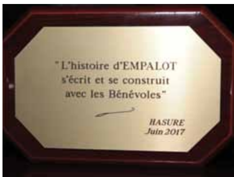
Prix des Bénévoles 2017 «HASUR-E»