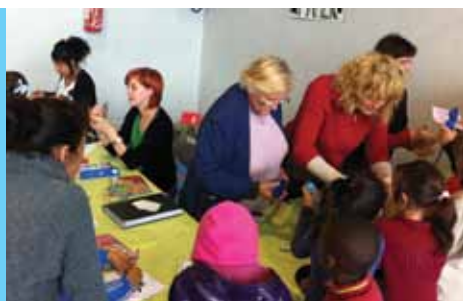
Bénévoles Fête de Quartier Empalot Hasur-E