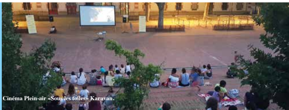
Cinéma Plein-air «Sous les toiles» Karavan.