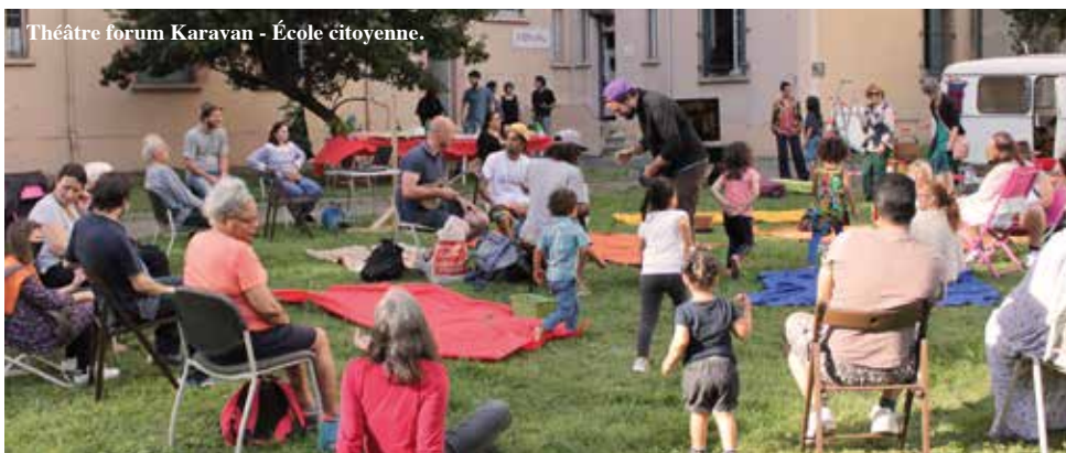
Théâtre forum Karavan - École citoyenne.

reprennent eux aussi leur activité. Ciné plein air, randonnées, balades, soirées astronomie, initiation à l'escalade, cours de yoga, ateliers de couture... Le « Programme des sorties, stages et animations – Été 2020 » est distribué dans les centres culturels et téléchargeable sur toulouse.fr