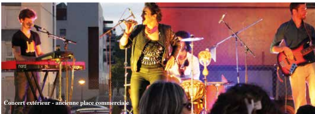
Concert extérieur - ancienne place commerciale