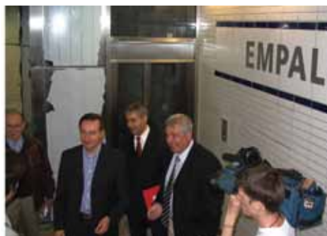
INAUGURATION DE LA STATION EMPALOT JUIN 2007