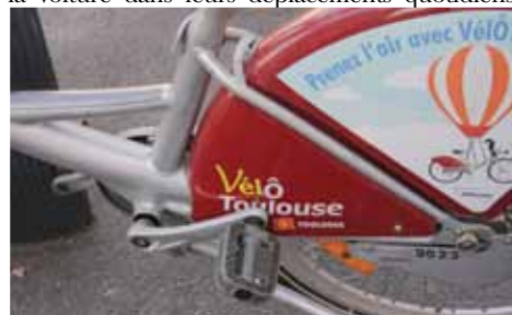
VÉLO STATION PROCHE DU MÉTRO EMPALOT AV J. MOULIN

Imaginer le Toulouse Métropole de 2030, ses modes de déplacement, ses transports en commun liés à son urbanisation présente et future, l'accessibilité de ses espaces publics pour tous dans un constant souci de protection de la planète. Voilà un défi ! Toutes les collectivités territoriales de plus de 100 000 habitants doivent élaborer un plan de déplacements urbains (PDU). Concrètement, il s'agit d'anticiper les besoins de déplacements à l'horizon 2030 et de réaliser les structures nécessaires. Ce projet, très large, va bien au-delà de la simple question du transport. Il englobe la protection de l'environnement, l'urbanisme, l'accessibilité, l'accroissement de la population, les nouvelles technologies... Fixés nationalement, ces objectifs se traduisent différemment selon les collectivités en fonction des équipements et de l'urbanisme existants. La population de Toulouse Métropole est en progression constante (707 000 habitants aujourd'hui, 15 000 supplémentaires chaque année) et les déplacements ne cessent d'augmenter. Un des grands enjeux sera de limiter l'usage de la voiture. Tout est mis en place pour que les habitants trouvent de plus en plus souvent et de plus en plus facilement, une alternative à la voiture dans leurs déplacements quotidiens.