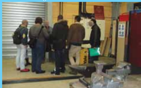
Visite Métier Stagiaires GRETA