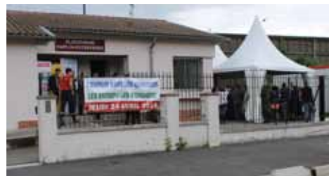
1ère Journée de recrutement à la PEE

La Mission Locale est un espace d'intervention au service des jeunes de 16 à 25 ans. Elle accueille, informe, oriente et accompagne les jeunes et les aide à résoudre l'ensemble des problèmes que pose leur insertion sociale et professionnelle. Chaque jeune accueilli bénéficie d'un suivi personnalisé dans le