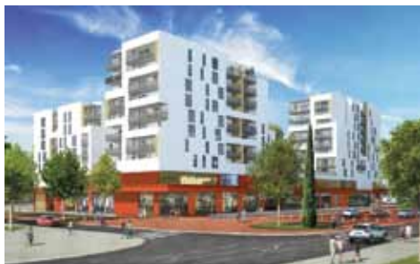
Nouveau centre commercial /... (suite de la page 7)