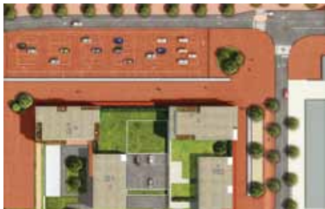
Parvis nouveau centre commercial

Habitat Toulouse, acteur majeur du logement social dans l'agglomération toulousaine et notamment sur le quartier d'Empalot, va mené, dans le cadre du GPV deux chantiers d'envergures sur Empalot : le relogement du 19 Cannes et la ré-sidentalisation de nombreux bâtiments. Pour le bâtiment 19 rue de Cannes, 144 ménages à reloger sur 2 ans avec une phase diagnostic des familles qui va débiter en ce mois de janvier et se poursuivre pendant trois mois. Et démarreront des propositions en suivant. La fin du relogement est prévue au 4ème trimestre 2017. 50% des locataires sont des personnes seules sans enfants, 21% sont des familles monoparentales, 55% des locataires ont plus de 10 ans d'ancienneté dans leur logement et 31% des locataires