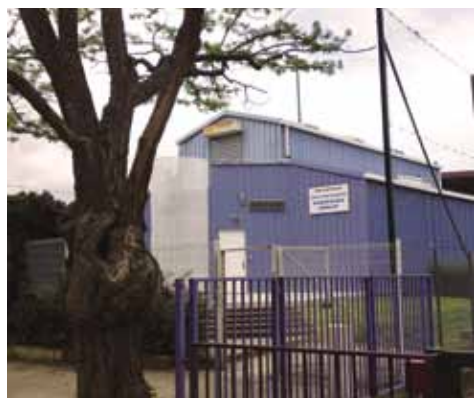
La Maison Bleue tirera sa révérence en janvier 2016

participation des habitant-e-s ; un lieu d'apprentissage et de la responsabilité, de l'engagement, de la citoyenneté ; un lieu pour développer l'esprit critique et contribuer à l'émancipation des personnes. Le rôle essentiel d'une maison de quartier est de porter une dynamique du mieux vivre ensemble favorisant le lien social, offrir des lieux ouverts à tous où habitant-e-s, associations et professionnels peuvent ensemble développer des projets d'animations et répondre aux besoins des familles et des différentes populations, des juniors aux seniors. Ce sont de vrais lieux de vie, animant et rythmant le quotidien du quartier. En ce sens, ils encouragent les échanges et les rencontres entre les générations. Une maison de quartier ça sert donc à tout et à tout le monde et ce pourrait être la définition la plus réaliste. De tels équipements doivent être également des acteurs à part entière du débat public qui anime l'ensemble des problématiques posées dans le quartier