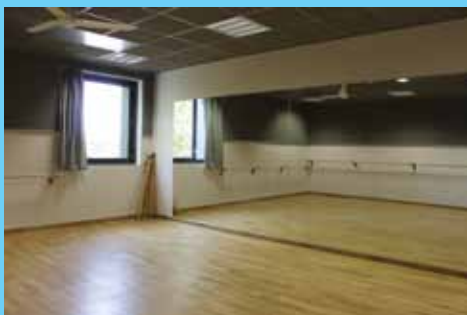
Salle de danse

Ensemble Main dans la main Paix Amitié Liberté Original Tous