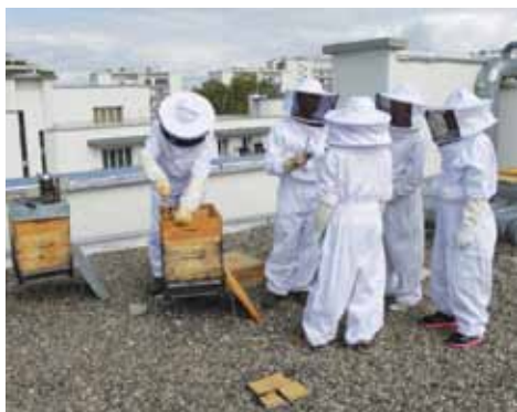
Récolte de miel sur le toit d'un bâtiment A.Daste.

Lorsque des structures font bouger le quartier