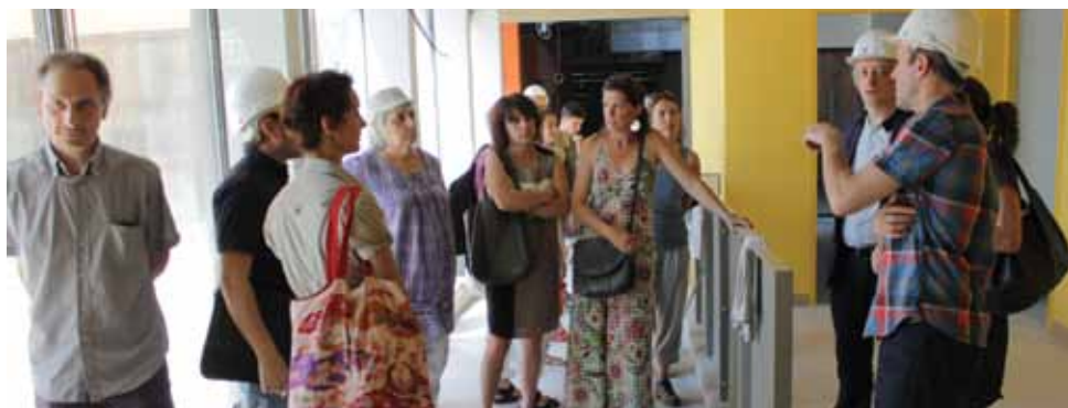
Visite de la «Brique Rouge» lors des travaux par les structures d'Empalot

: sociales, économiques, culturelles. Ils doivent, par leurs implantations géographiques tenir compte des proximités qui les traversent. Une Maison de quartier est un équipement où chacun doit trouver sa place lorsqu'il envisage de participer à l'action commune, elle est à la fois une suite, un trait d'union entre moments, elle grandit avec celles et ceux qu'elle fait grandir, elle est une boîte à outils. Ces maisons de quartier peuvent être gérées soit par des collectivités territoriales du type municipalité, comme c'est le cas sur le quartier d'Empalot, soit par des associations loi 1901 comme c'est le cas à Bagatelle.