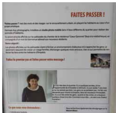
Plaquette promotion «Faites Passer!»