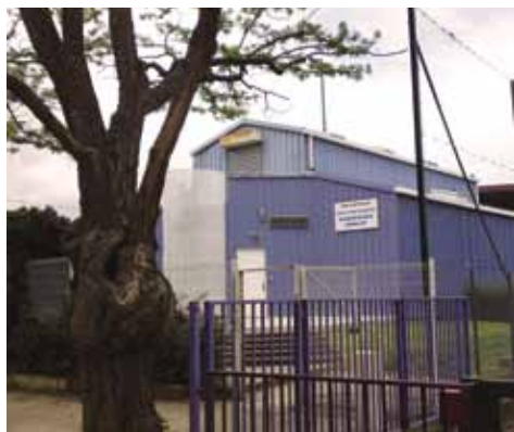
La Maison Bleue tirera sa révérence en janvier 2016

participation des habitant-e-s ; un lieu d'apprentissage et de la responsabilité, de l'engagement, de la citoyenneté ; un lieu pour développer l'esprit critique et contribuer à l'émancipation des personnes. Le rôle essentiel d'une maison de quartier est de porter une dynamique du mieux vivre ensemble favorisant le lien social, offrir des lieux ouverts à tous où habitant-e-s, associations et professionnels peuvent ensemble développer des projets d'animations et répondre aux besoins des familles et des différentes populations, des juniors aux séniors. Ce sont de vrais lieux de vie, animant et rythmant le quotidien du quartier. En ce sens, ils encouragent les échanges et les rencontres entre les générations. Une maison de quartier ça sert donc à tout et à tout le monde et ce pourrait être la définition la plus réaliste. De tels équipements doivent être également des acteurs à part entière du débat public qui anime l'ensemble des problématiques posées dans le quartier