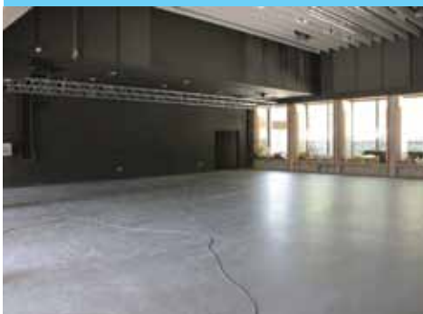
Salle de spectacle

J'ai hâte de découvrir la nouvelle salle de spectacle. J'espère qu'il y aura de belles choses et une bonne programmation. Ça nous manquait sur le quartier une vraie salle de spectacle !