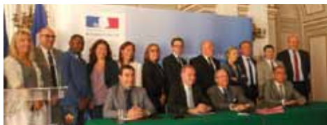
Signature conventions Préfecture de la Haute-Garonne