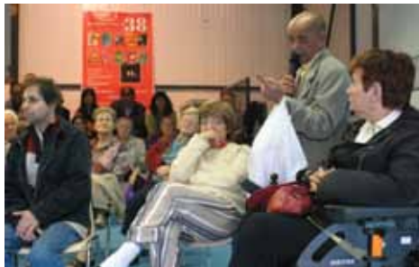
Conseil de Quartier oct 2005

Pour tout renseignement: Hasur-E 18, rue de Menton -Tél. 05 61 52 13 21 – 06 88 32 27 08