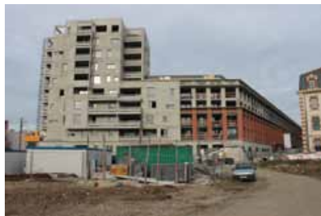
Chantier 69 logements SA des Châlets à Niel

À Niel, c'est une nouvelle résidence, de la SA des Châlets, de 69 logements qui vient de sortir de terre et sa livraison est prévue en juin 2014. Quant au futur réctorat il sera livré courant 2015.