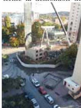
Destruction Lavandou Déc 2013

Projet global de développement urbain, social et économique au service des habitants, voilà ce que représente le Grand Projet de Ville dit GPV. Il vise à changer l'habitat social et son environnement en travaillant sur les causes urbanistiques et les conséquences sociales à l'origine de leur déclassement. À Empalot, la zone concernée par ce projet, dite ZUS (Zone Urbaine Sensible) priorité de la politique de la Ville de rénovation urbaine s'étend sur 41 ha où habitent environ 5 685 personnes (Insee 2006) et les logements sociaux représentent plus de 86% de l'habitat total. Le renouvellement urbain est engagé sur 15 ans avec à terme la démolition de 900 logements, la construction de 1 600 logements neufs, la construction de plus de 7 000 m 2 de commerces et services. 2013 a été une année charnière, qu'en est-il pour 2014 ?.