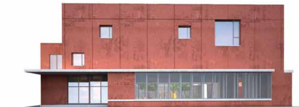
Future Maison de Quartier

Témoignages sur le thème du mois : «Où en est-on du GPV?»