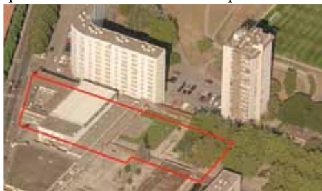
Emprise future Maison de Quartier

Dans le courant du mois de janvier va démarrer la construction d'un nouvel équipement de 1539 m 2 regroupant la Maison des Jeunes et de la Culture, le Point Info Mairie, la permanence de la CPAM et une salle polyvalente très attendue. Cet équipement se voudra convivial et à échelle humaine de par son architecture et ses matériaux (transparence du verre et béton coloré). Après cette première phase, une extension du gymnase actuel permettra d'accueillir de nouvelles salles d'activités dédiées comme un dojo ou salle de danse, etc. Outre le fait que cette maison de quartier facilitera les liens intergénérationnels, elle offrira au quartier une véritable salle de spectacle. Plus