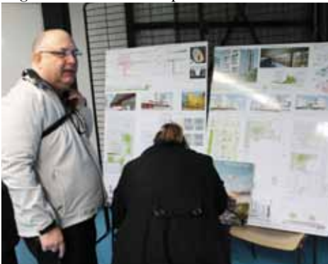
Présentation îlot EMI