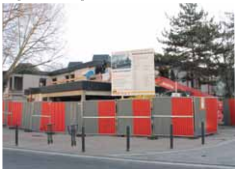
Façade CS travaux