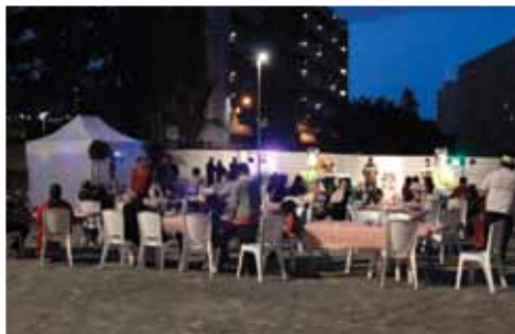
Animation friche 24-sept 2013

À ce jour ce sont 316 logements de Draguignan, Fréjus et Lavandou qui ont été détruits, laissant place à des friches. Ces friches sont aujourd'hui des espaces aménagés avec des équipements provisoires afin d'accueillir publics et diverses animations locales. Ces friches vivront de un à deux ans en attendant les prochains chantiers. Concernant l'immeuble 23 rue de Grasse, c'est 152 logements avec 150 le début de sa démolition. Aujourd'hui la situation de cet immeuble en chiffre : 2 logements vacants ; 9 départs volontaires ; 53 relogements effectués ; 1 décohabitation 23 accords de principe soit au total 77