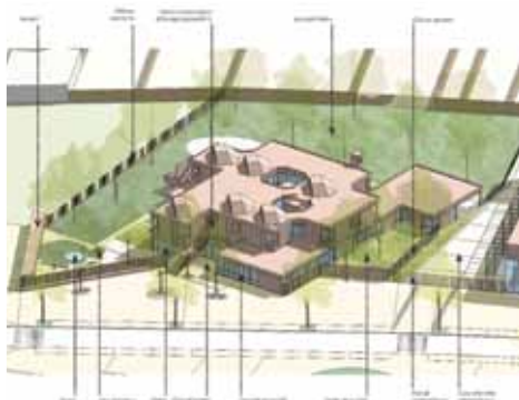
Plan aménagement CS