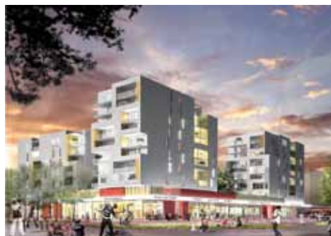
Esquisse futur Centre Commercial et logements