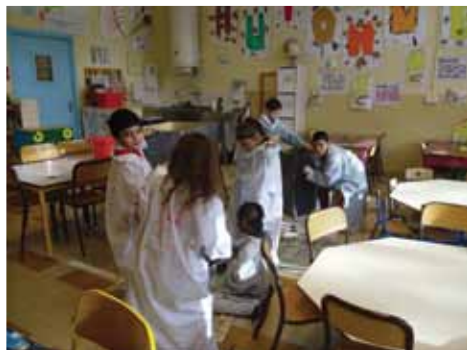
Atelier art plastique clae Aifomej - Léo Lagrange

J'écris! Les jeunes ne considèrent pas leurs mails, et autres outils de communication moderne comme de l'écriture. Ils pensent par contre que bien écrire est une compétence essentielle contrairement aux idées reçues.