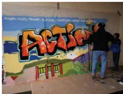
Daste Arts Graphiques - CM1/CM2 André Daste

outils modernes comme les jeux, sites web et multimédia (pour 78 %). Les fonctions discursives des écrits atypiques produits par les jeunes sur les supports modernes de communication jouent donc un rôle primordial pour la construction de ceux-ci, la création de procédés permettant d'exprimer des émotions plus difficiles à transmettre à l'écrit derrière un ordinateur, qu'à l'oral lors d'une discussion, ainsi que d'instaurer une tonalité spécifique dans un discours donné. Les jeunes veulent écrire vite, vrai, et de manière originale. L'objectif premier est d'influer sur le sens du discours en mettant en œuvre diverses stratégies de représentations linguistiques. ■