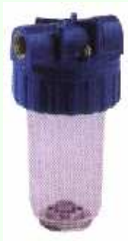
Filtre à cartouches

- soit un filtre général à l'arrivée d'eau à la maison.