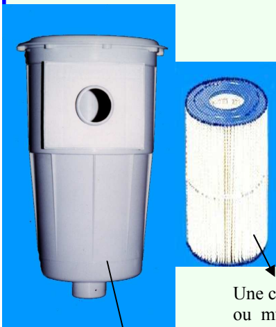
Une cartouche plissée, ou multi-cartouches