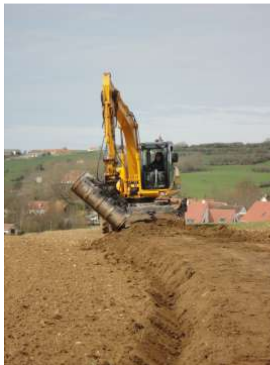
Pendant les travaux