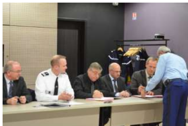
Signature du protocole Commune / Etat / Gendarmerie Le jeudi 11 décembre 2014 à la CC de la Terre des 2 Caps à Marquise