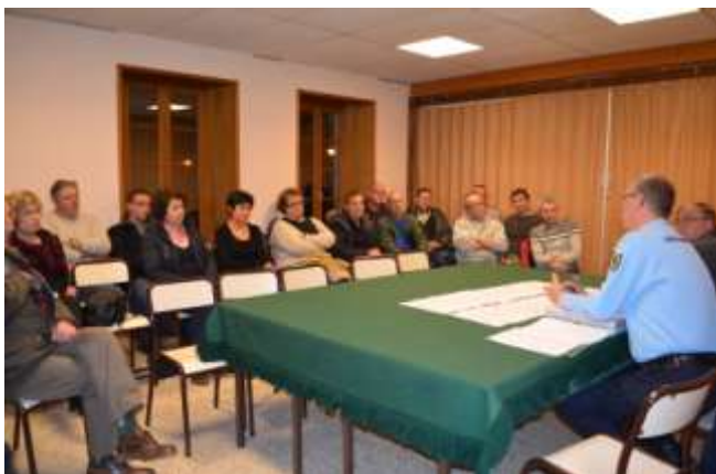
Réunion de formation et Signature des engagements individuels en qualité de voisin vigilant Le jeudi 27 novembre à la salle communale

Le lieutenant pourra éventuellement vous recevoir pour vous orienter et vous donner toutes les informations utiles.