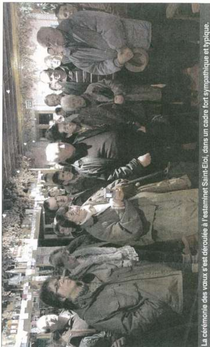
La cérémonie des vœux s'est déroulée à l'estaminet Saint-Eloi, dans un cadre fort sympathique et typique.

Des travaux ont cependant été réalisés avec la remise en état de l'impassé des Prés, de l'impassé de la Louve et la création de deux terrains de pétanque. 2011, c'était aussi une programmation de fermeture de classe. « Les parents d'élèves se sont mobilisés et grâce à la